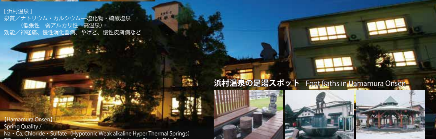
浜村温泉の足湯スポット Foot Baths in Hamamura Onsen

【浜村温泉】 泉質／ナトリウム・カルシウム一塩化物・硫酸塩泉 (低張性 弱アルカリ性 高温泉) 効能／神経痛、慢性消化器病、やけど、慢性皮膚病など