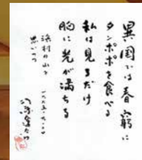
司馬遼太郎氏が残された書 Calligraphy by Ryotaro Shiba who is a famous writer in Japan

Facilities: Total capacity 100 people / Number of guest rooms 16