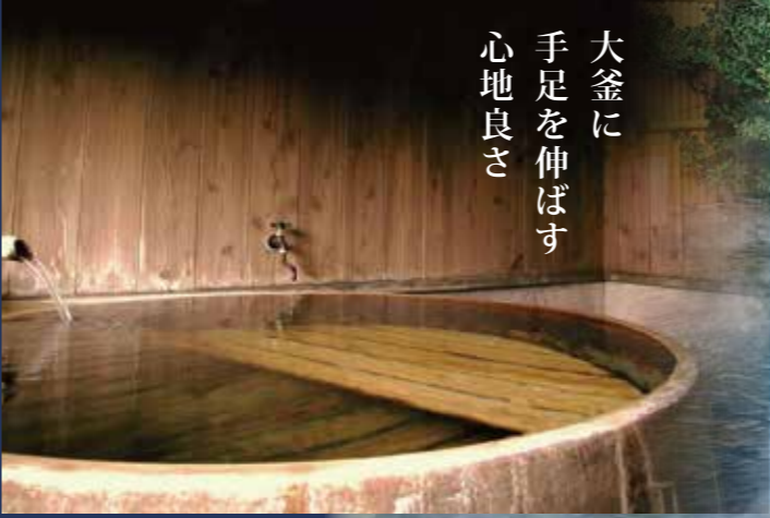
貸切内湯「大酒釜風呂」 地元の酒蔵より譲り受けた直径2mの大釜です。