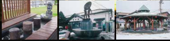
ヤサホーパーク JR 浜村駅前 ゆうゆう健康館けたか前

【Hamamura Onsen】 Spring Quality / Na・Ca, Chloride・Sulfate (Hypotonic Weak alkaline Hyper Thermal Springs) Efficacy / Neuralgia, Chronic Gastroenterology, Skin burn, Chronic Skin Disease, etc.